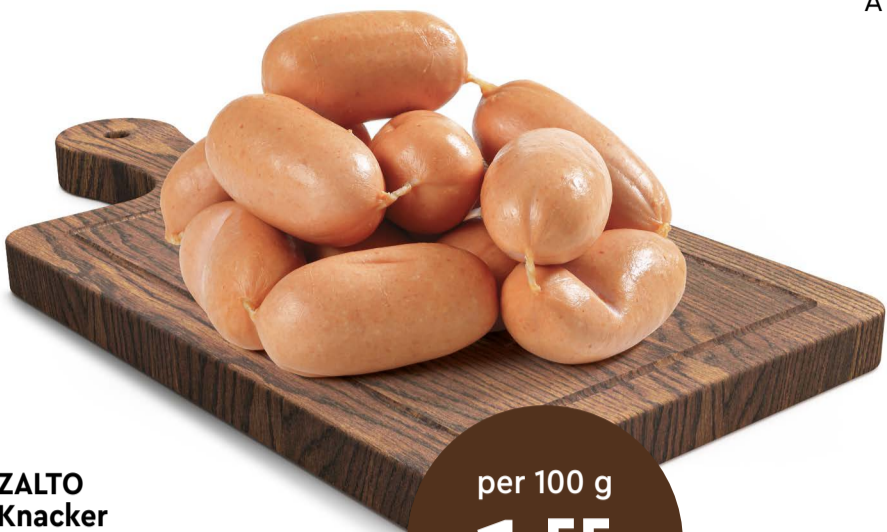
ZALTO Knacker in Bedienung

Angebote gültig ab Donnerstag, 25.04. bis Donnerstag, 02.05.2024