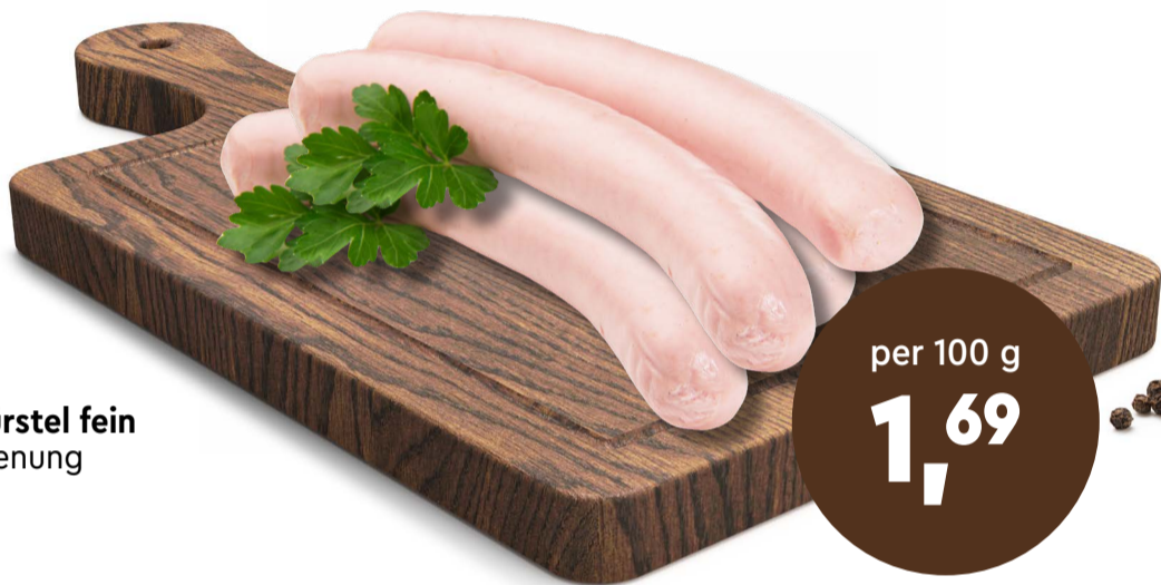
ZALTO Bratwürstel fein in Bedienung